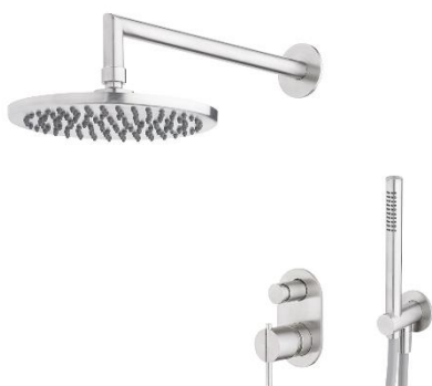
Douchegarnituur Waterevolution S22 inbouw doucheset RVS satin