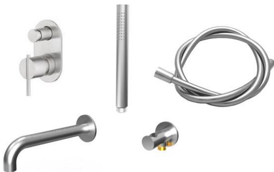
Badkraanset Waterevolution T4.332BI T4.32BE T1.671.19.IE T1.620.IE T1.624.IE FLEX1.170.IE Alleen van toepassing op 46B