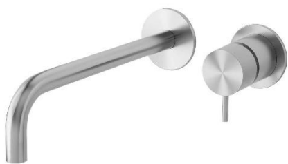
Wastafelkraan Waterevolution Flow fonteinkraan RVS met uitloop 25cm. De Waterevolution kranen zijn van hoogwaardig 316 RVS, ontworpen en geproduceerd in Portugal.