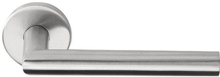
Deurkruk Formani Basic LB3 19mm rond rozet RVS satin