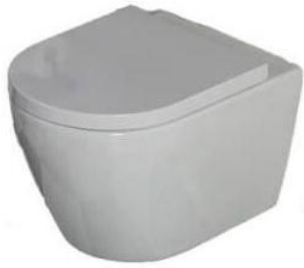
Toiletcloset Sanclair – Jama wandcloset met softclose zitting