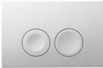
Drukpaneel toilet Geberit Delta 25 wit