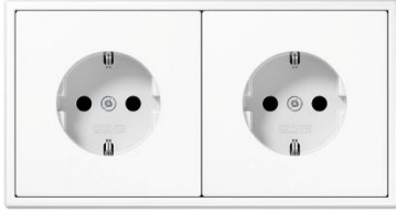
Wandcontactdozen Jung LS990 alpine wit