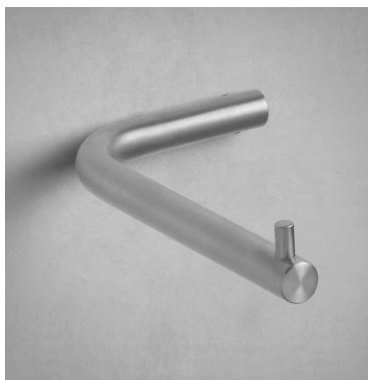
WC-rolhouder Waterevolution A1.30.IE RVS satin