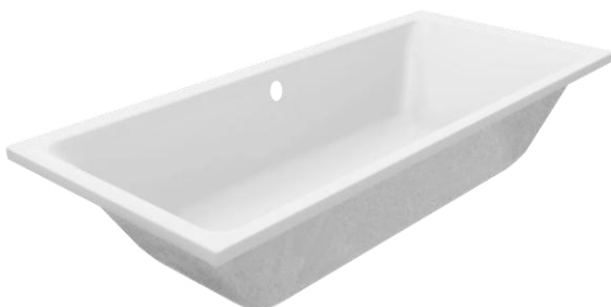
Ligbad Luca Varess Sandrina inbouwbad Alleen van toepassing op 46B