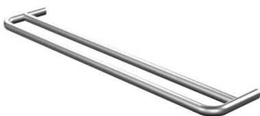
Handdoekhouder Waterevolution A1.12D.IE RVS satin