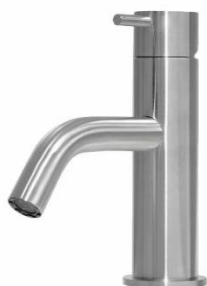
Fonteinkraan Waterevolution Flow RVS satin