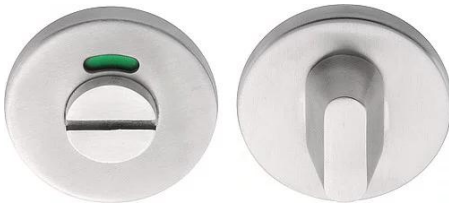
Vrij bezet garnituur Formani 1501T020INXX0 RVS satin